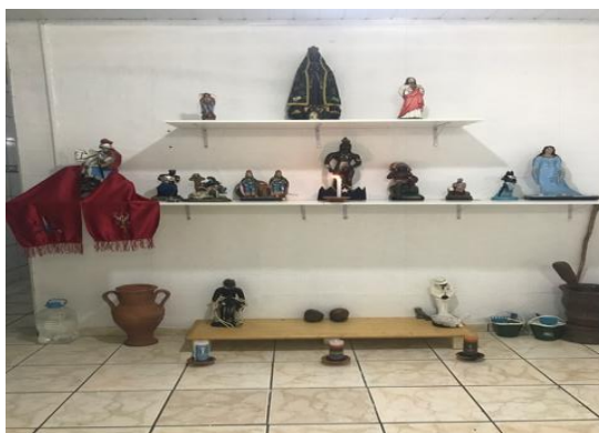
FIGURA 1: Altar com as imagens sincréticas dos Santos/Orixás da Umbanda